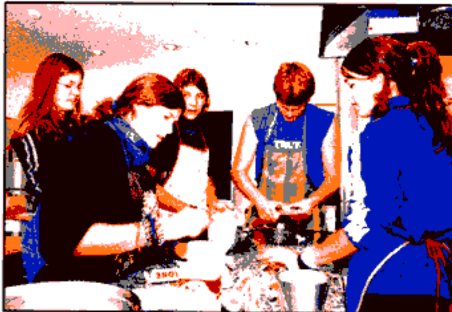
TEAMWORK: In der Küche läuft es rund. Kochen ist für die Jungen der tägliche Höhepunkt des dreiwöchigen Kurses.

Schreiben Sie uns an: Redaktion SonntagsBlick, Dufourstrasse 23, 8008 Zürich, oder via Internet: www.sonntagsblick.ch